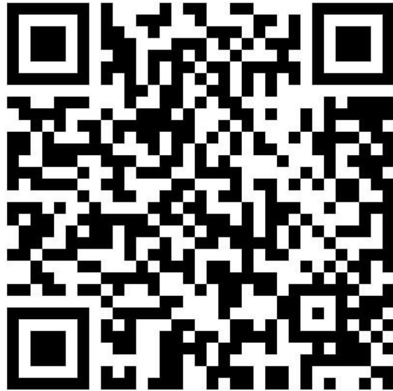
Template Monitoring FORTASI oleh Daerah